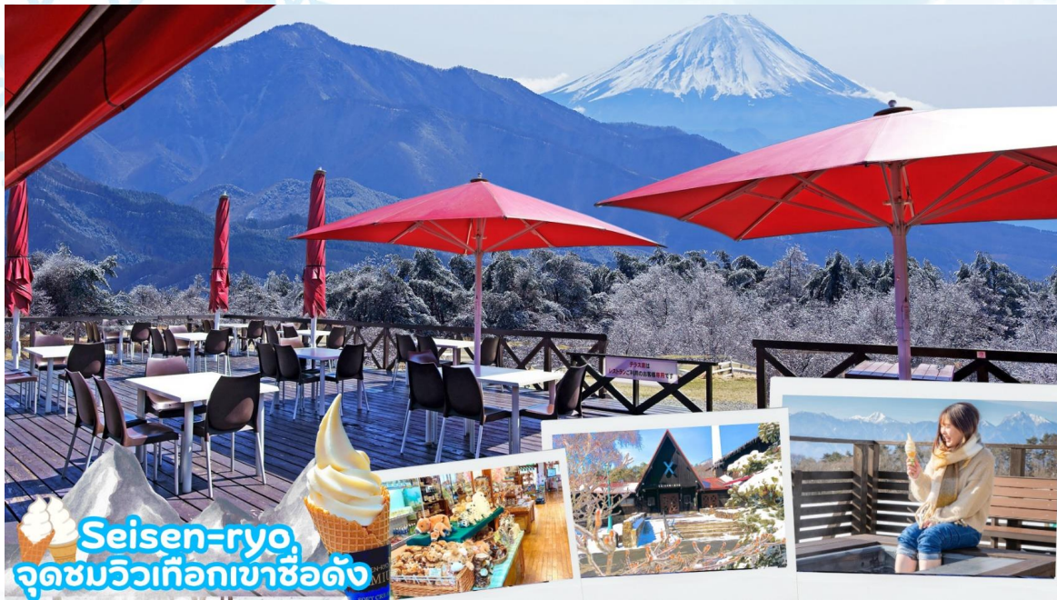
Seisen-ryo จุดชมวิวกึ่งภูเขาชื่อดัง

เมืองโฮคุโตะ (Hokuto) ตั้งอยู่ทางตะวันตกเฉียงเหนือของจังหวัดยามานาชิ เป็นเมืองที่ล้อมรอบไปด้วยภูเขาสูง เช่น ภูเขาýtสึงาตาเกะ เทือกเขาแอลป์ตอนใต้ ภูเขาคินปู และภูเขาคายะงาตาเกะนอกจากนั้นยังสามารถเห็นวิวที่สวยงามของภูเขาไฟฟูจิได้อีกด้วยมีทรัพยากรธรรมชาติที่มีคุณภาพ ไม่ว่าจะเป็นน้ำแร่ เมล็ดข้าว และผลิตภัณฑ์จากนมวัว